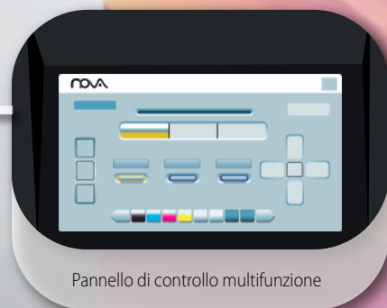
Pannello di controllo multifunzione