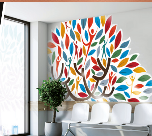
GRAFICHE PER FINESTRE E PARETI