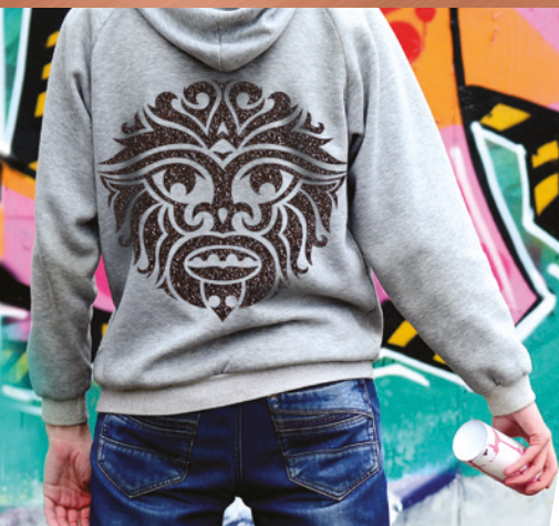
TRASFERIMENTO TERMICO PER ABBIGLIAMENTO