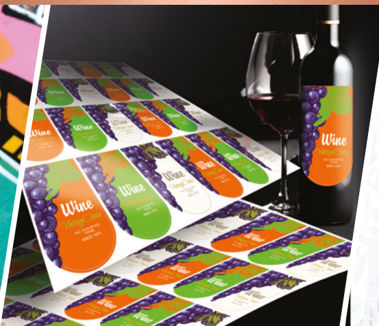
ETICHETTE E ADESIVI