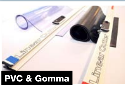
PVC & Gomma