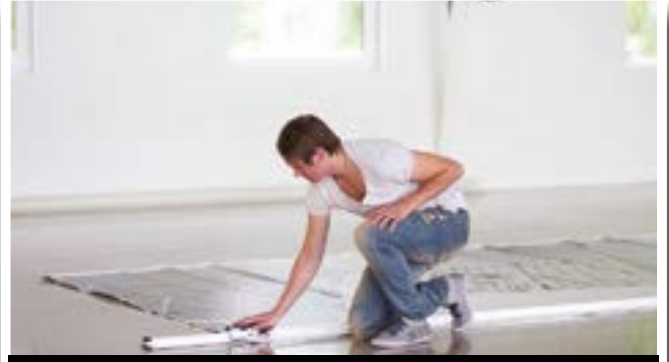
Colloca la taglierina nella posizione di taglio.