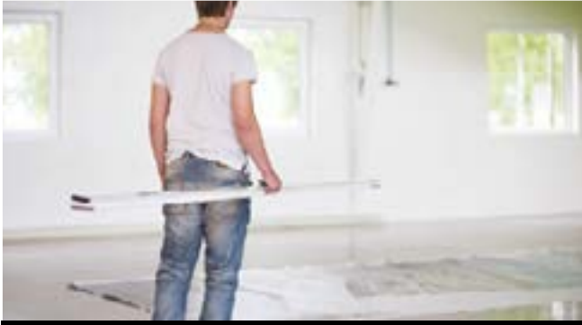
Leggera e facile da trasportare.