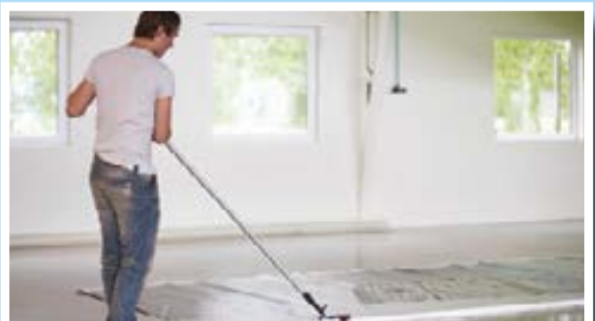
Per tagli lunghi utilizza l'asta estendibile.