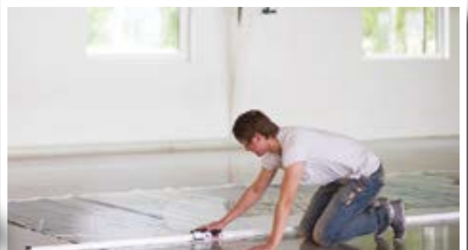
Utilizza manualmente per tagli brevi.